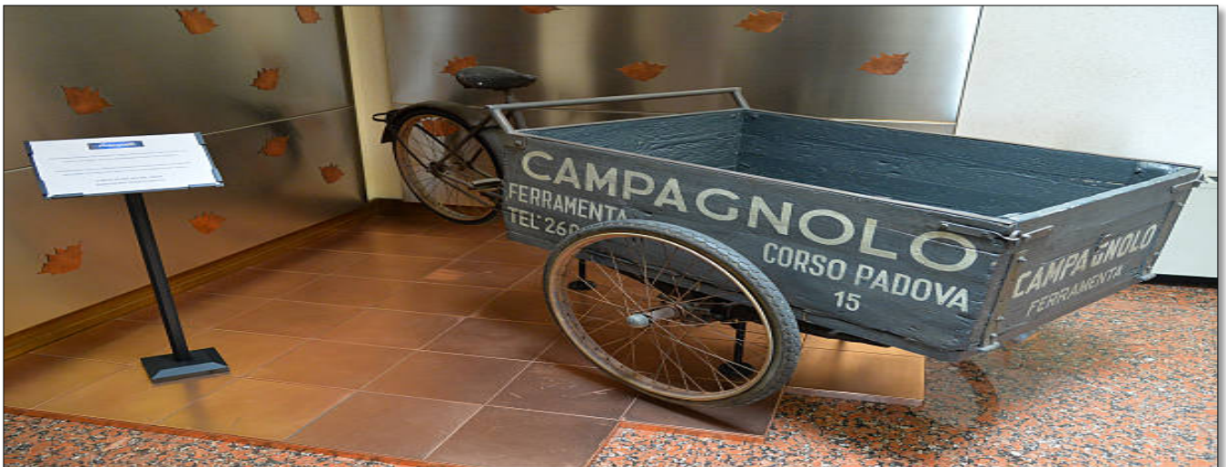
Le chariot de livraison en 1940

Recul de selle, inclinaison du bec de selle, tous les réglages se faisaient au millimètre selon les souhaits du coureur.