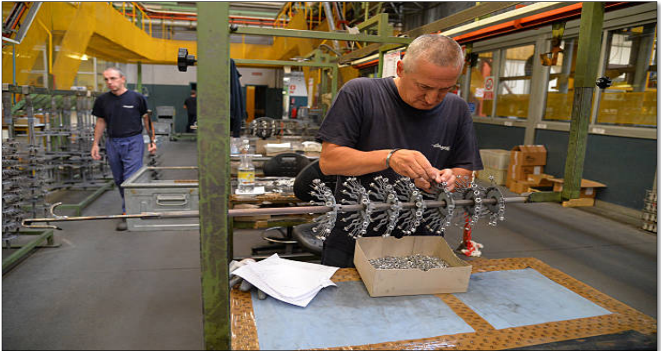
La mécanique d'ultra précision

Les roulements c'était la grande force de Campa. Tout comme les pédaliers et les pédales. A l'époque Shimano était en dessous de Campagnolo.