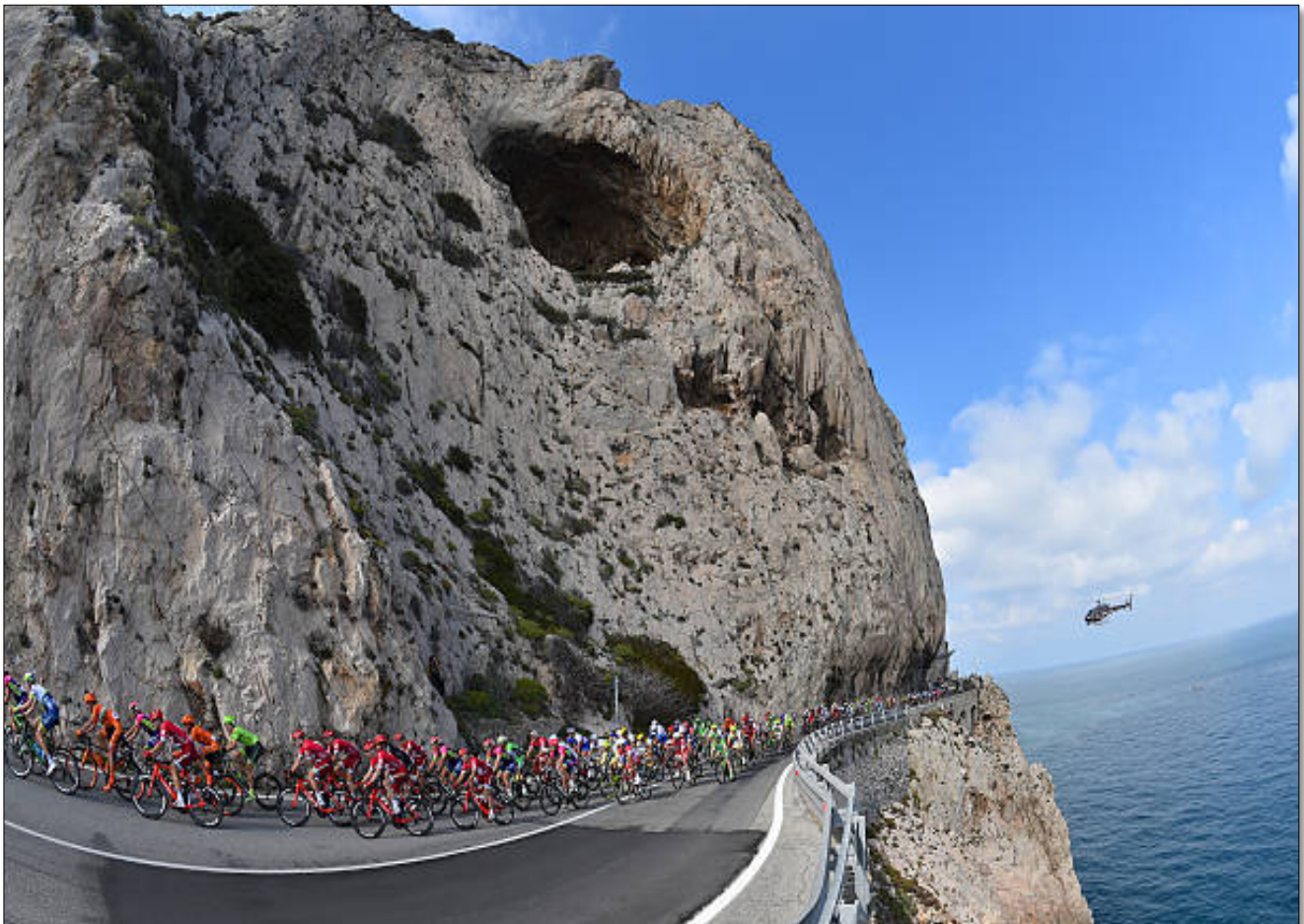
La belle route en corniche du littoral

La Primavera passe d'un univers laborieux de l'arrière-pays Génois aux promesses d'une vie meilleure.