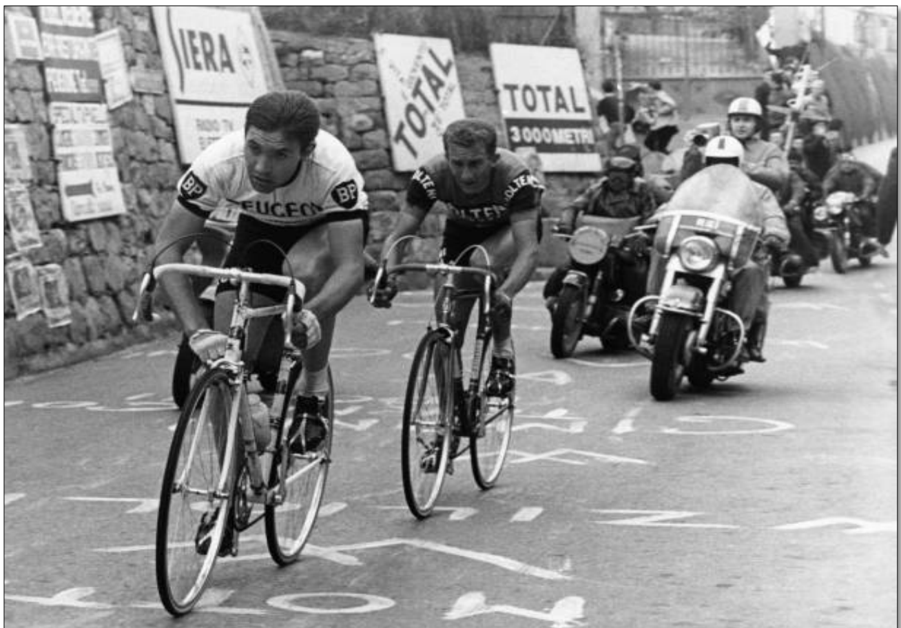
Merckx attaque le Poggio. Gianni Motta est dans sa roue.

Merckx c'est mieux que Van Looy ; C'est Van Looy plus Anquetil. Merckx n'est pas flamand mais Bruxellois. Un champion global, respectueux de la tradition avec les Italiens. Il gagnera sept fois, un record. Très étrangement, c'est dans Milan Sanremo que Merckx, alors sur le déclin, obtient en 1976 une dernière grande victoire internationale. Là où il s'était révélé.